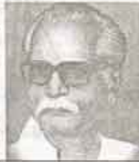
தமிழாக வாழ்ந்த இலக்குவனார்

தோற்றமும் வளர்ச்சியும்’ என்னும் தலைப்பில் ஆங்கிலத்தில் ஆராய்ச்சிக் கட்டுரை எழுதி எம்.ஓ.எல். பட்டமும் பெற்றார்.