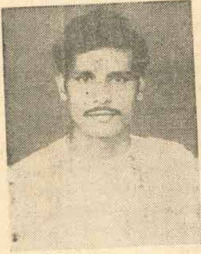
பாவலர் செங்கை அழகன்

சீரும் சிறப்புற்றார் செம்மல் இலக்குவனார் கூறும் தமிழ்மொழியைக் கொஞ்சு!